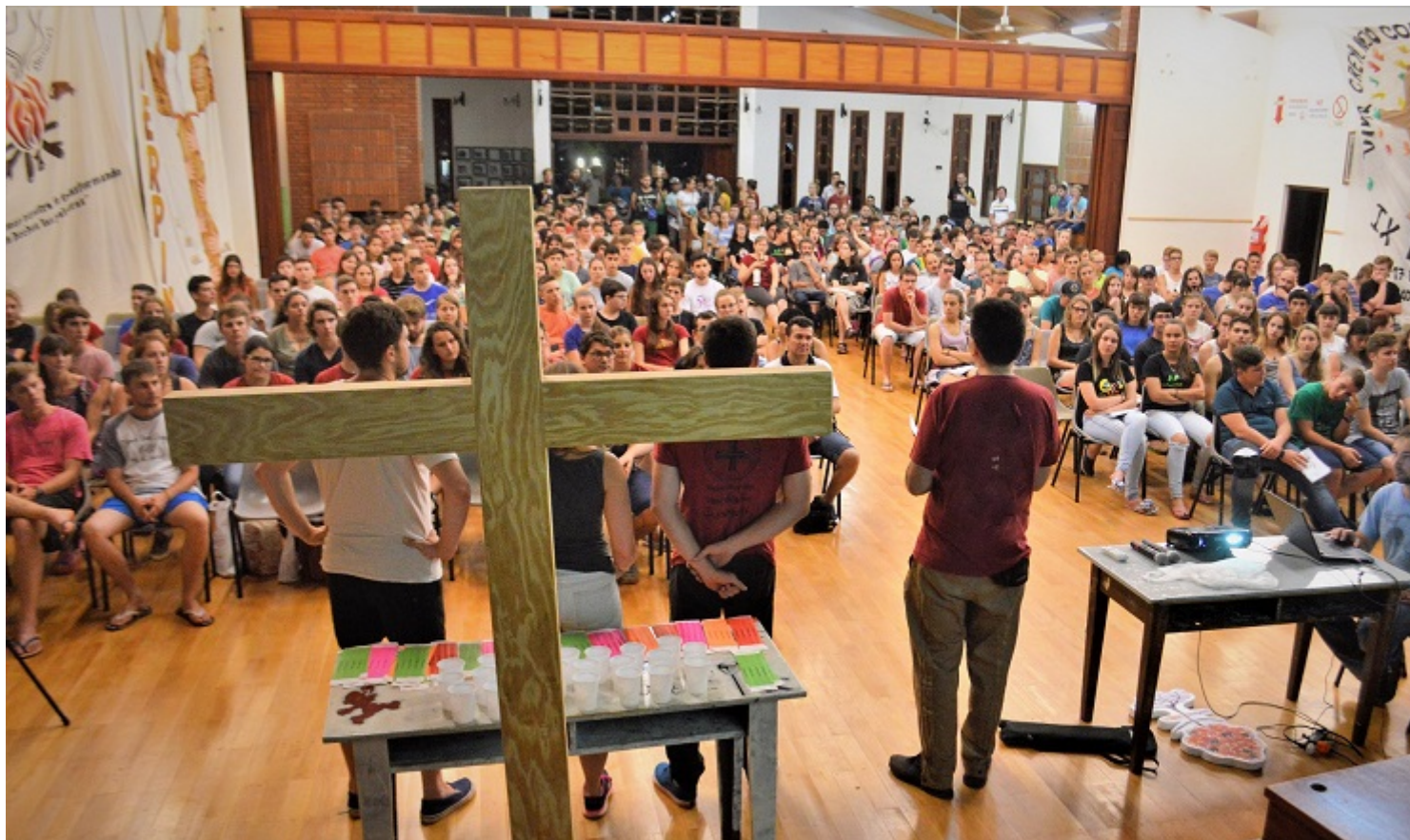
Una reunión en la Iglesia Luterana IERP de Uruguay

(URUGUAY, 18/10/(2018) La Federación de Iglesias Evangélicas de Uruguay (FIEU) , entidad con más de 62 años de existencia en el país charrúa, que integra a reconocidas iglesias y entidades de la comunidad evangélica, en Uruguay y en el mundo, ha querido desmarcarse, a través de una