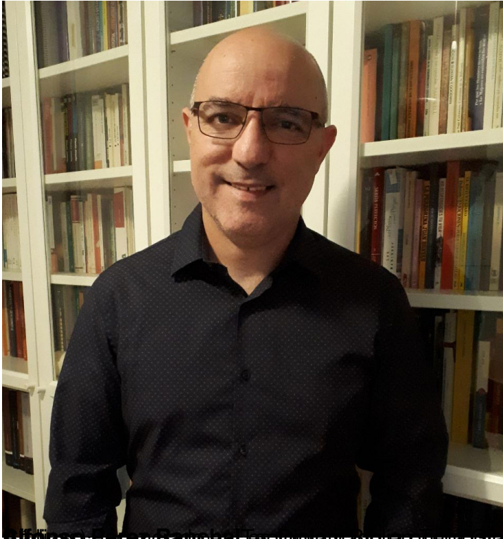
Profesor de Teología Fundamental y Antropología Cultural en el CEIB (Centro de Estudios Bíblicos) y profesor de Sagradas Escrituras en la Universidad de Navarra.