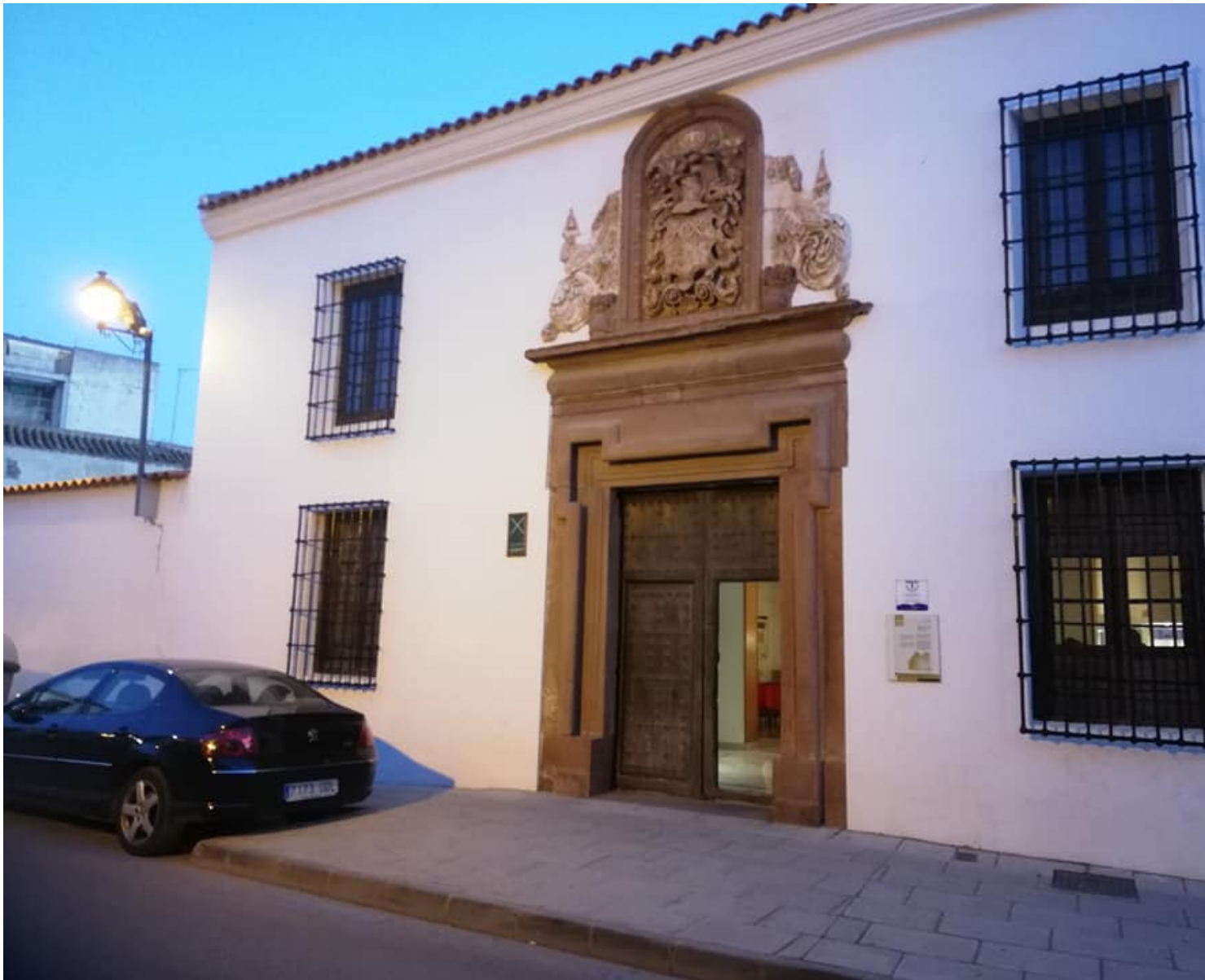
Fachada del Museo Municipal de Alcázar de San Juan, donde se celebró el acto

El acto de presentación tuvo lugar en el notable escenario del Museo Municipal de Alcázar de San Juan, construido sobre un yacimiento arqueológico en el que pueden apreciarse espectaculares mosaicos romanos de los siglos I y II.